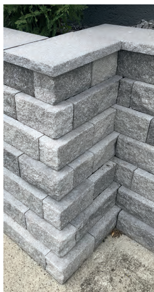
Eckausbildung 90° und Gehrungsschnitt